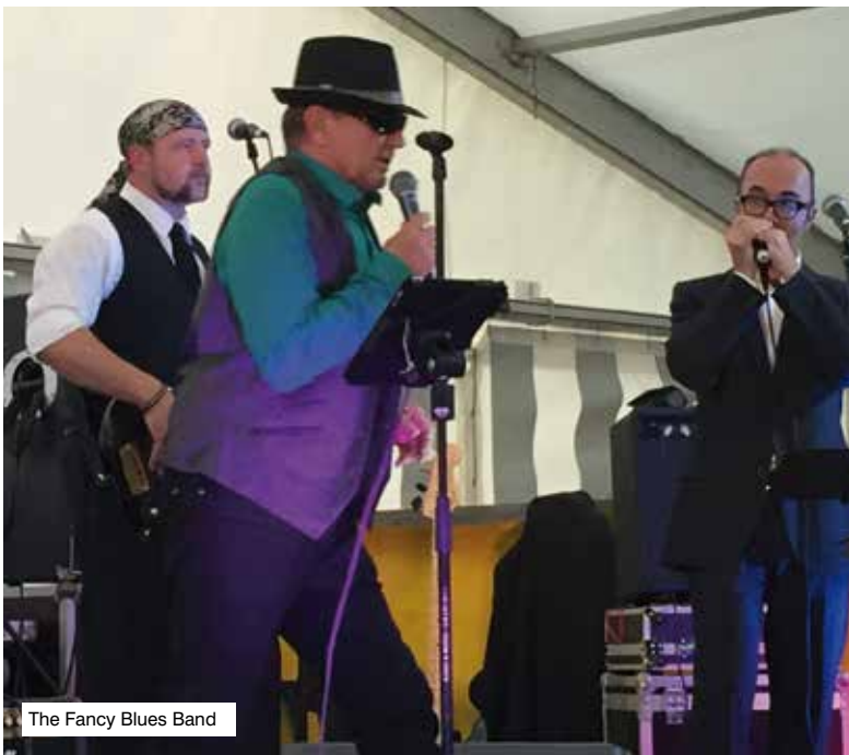
The Fancy Blues Band