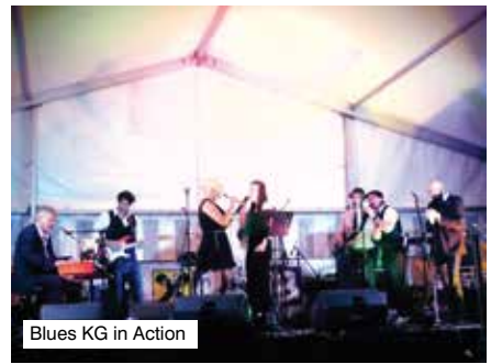
Blues KG in Action