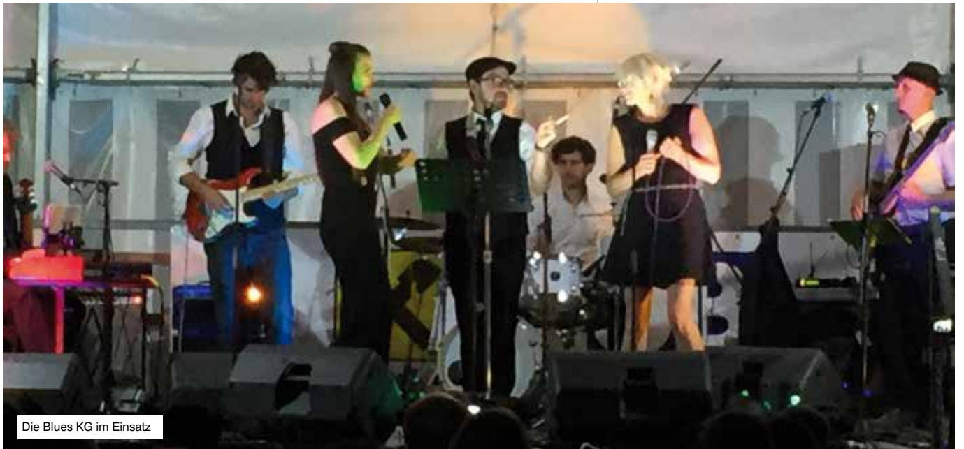
Die Blues KG im Einsatz