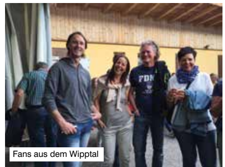
Fans aus dem Wipptal